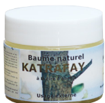
Baume Katrafay, à la cire d'abeille, 40 g Soulage en cas de courbatures