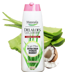
Lait Corporel, DELALOES, 400 ml Hydrate, nourrit en profondeur le corps