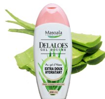
Gel Douche, DELALOES, 200 ml Nettoie Hydrate