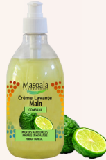
Savon Crème Main, Combava, 500 ml Nettoie, hydrate