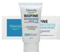
Pommade réparatrice et apaisante, BIOFINE, 50 ml Aide à cicatriser les plaies superficielles, apaise