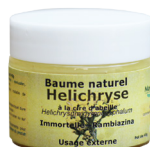
Baume Helichryse, à la cire d'abeille, 40 g Apaise les piqures d'insecte