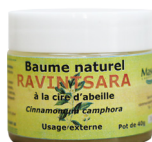
Baume Ravintsara, à la cire d'abeille, 40 g Antiviral