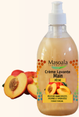
Savon Crème Main, Pêche, 500 ml Nettoie, hydrate