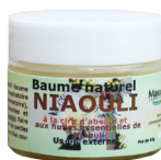
Baume Niaouli, à la cire d'abeille, 40 g Antiviral