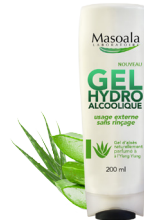
Gel Hydroalcoolique à l'aloès, 200 ml Antiseptise, hydrate