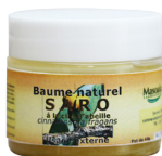
Baume Saro, à la cire d'abeille, 40 g Antiviral