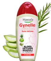
Soins intimes, GYNELLE, 200 ml Aide à apaiser les irritations et les démangeaisons