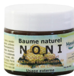
Baume Noni, à la cire d'abeille, 40 g Anti-inflammatoire