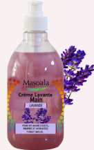
Savon Crème Main, Lavande, 500 ml Nettoie, hydrate