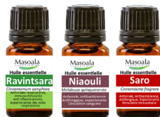
Huiles essentielles Cinnamomum camphora , Melaleuca quinquenervi , Cinnamosma fragrans