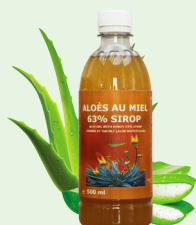
Aloès au miel, 63% sirop, 500 ml

Aide à la digestion, renforce le système immunitaire