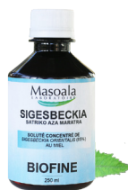
Sigesbeckia soluté buvable, BIOFINE, 250 ml Aide à la cicatrisation interne